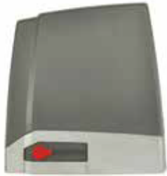
MEKO Motoredutor, central eletrónica embutida e recetor 433.92 MHz

Rack-driven gear motor with embedded control board, 433,92 Mhz radio receiver